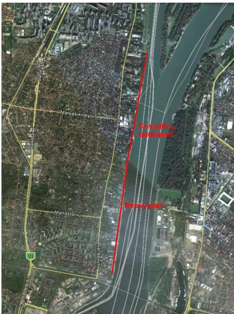
1. kép: A római part és a Kossuth L. üdülőpart műholdképe.

A fejlesztéssel érintett területről készült műholdkép az 1. sz. képen látható.